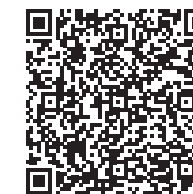
SCHÉMA DIRECTEUR ENVIRONNEMENTAL DE LA RÉGION

Avec Alain Aspect, prix Nobel de physique 2022, professeur à l'Institut d'Optique Graduate School, professeur à l'École Polytechnique Avec Etienne Klein, physicien, directeur de recherches au CEA