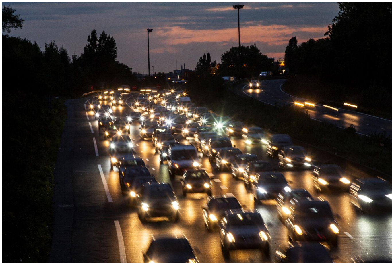
Circulation automobile dense

Les actions en rapport avec la circulation automobile traiteront donc de sécurité routière, de qualité environnementale mais aussi de report modal afin de résoudre les points noirs routiers identifiés.