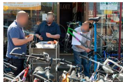
Atelier de réparation de vélos aux Ulis