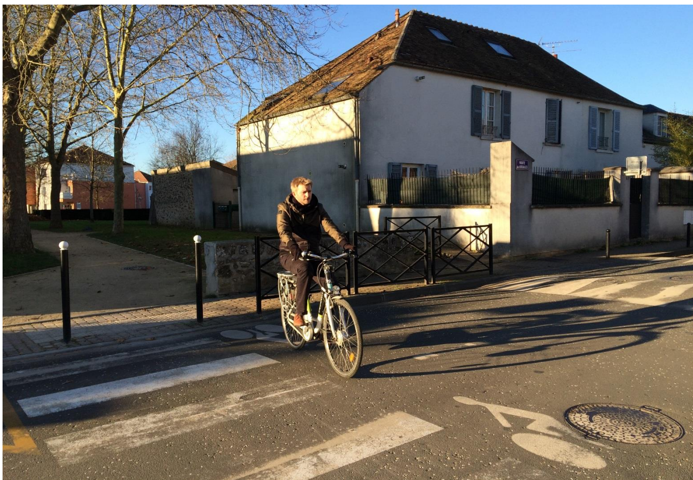
Circulation à vélo

Afin de favoriser les déplacements à vélo , notamment pour les motifs domicile-travail et domicile-études, un travail devra être effectué sur les freins à son utilisation . Ces freins ont été identifiés lors du diagnostic du Schéma de transports et chacune des actions proposées ci-après vise à les dépasser.