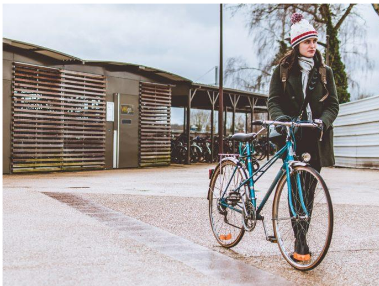
Exemple de vélo station Véligo

En partenariat avec IDFM, le territoire de la CPS bénéficierait d'une offre de location longue durée de vélos à assistance électriques destinée à favoriser le changement des comportements. Les usagers hésitant à acheter un VAE pourront tester cette solution pendant 1 à 6 mois.